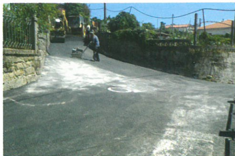
Pavimentação da rua das Rosas - Serradelo