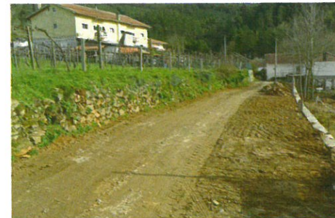
Alargamento do Caminho do Crasto - Real