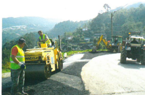
Pavimentação de alargamento na EM503