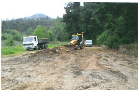
Limpeza das margens do Rio Arda em parceria com a Junta de Freguesia