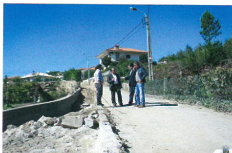
Alargamento, construção de infraestruturas de saneamento conduta de abastecimento de água e pavimentação na Quinta da Eira - S. Martinho