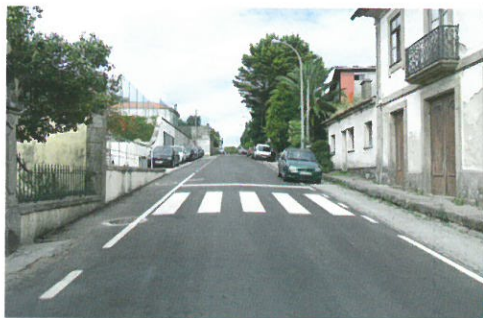
REQUALIFICAÇÃO URBANÍSTICA / Rua Emídio Navarro