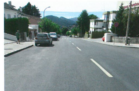
REQUALIFICAÇÃO URBANÍSTICA / Avenida General Humberto Delgado