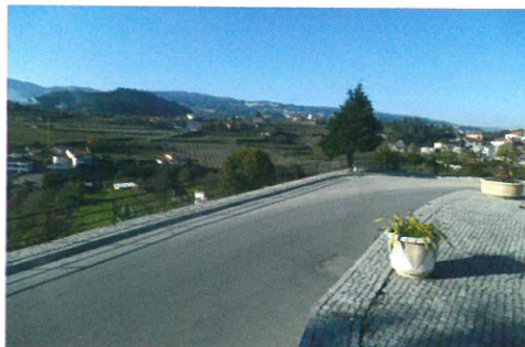
Construção de passeio e colocação de grades no caminho da Igreja em parceria com a Junta de Freguesia