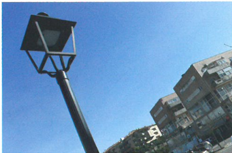
Colocação de iluminação led no Largo Prof. Joaquim Quintas - Sobrado em parceria com a Junta de Freguesia