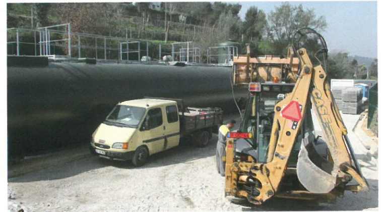
ETAR de Pedorido

O autarca paivense congratulou-se com a concretização deste equipamento, evidenciando a forte aposta realizada em matéria de saneamento básico, destacando que a ETAR de Fornos, e os equipamentos que estão a ser concluídos em Pedorido e Sardoura, são estruturas que vão potenciar um ambiente mais saudável e uma melhor qualidade de vida para a população paivense.