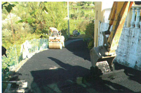
Pavimentação do Caminho de Rismos