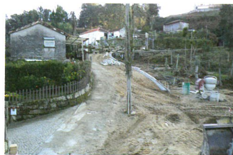
Alargamento do caminho do Crasto à Triguinho Mau - Fornos