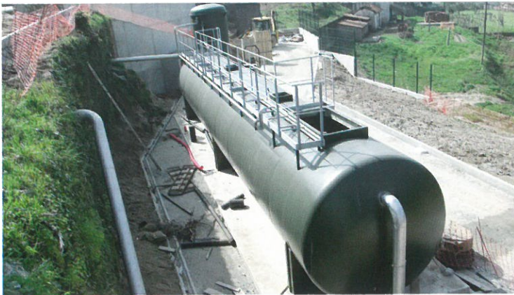
Visita à ETAR de Sardoura