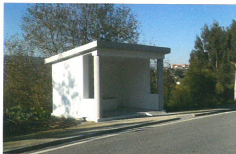
Construção de paragem de autocarro em Montouro - S. Martinho em parceria com a Junta de Freguesia