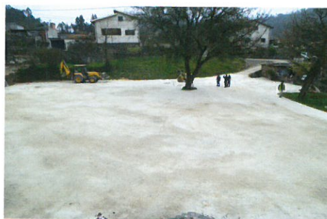
Arranjo do Largo de Sta Barbara - Folgoso (1ª Fase)