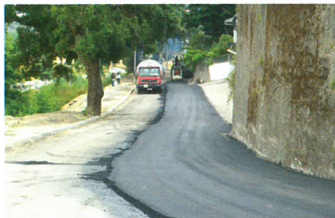
Pavimentação do caminho de curveta