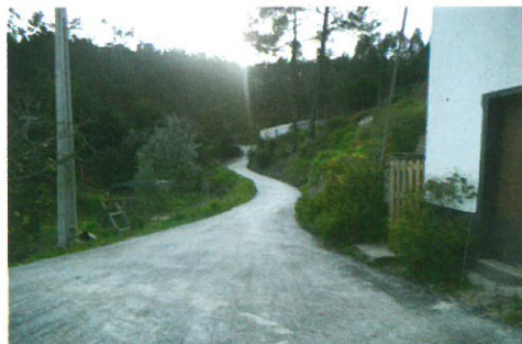
Construção de valetas e pavimentação do caminho da Mina da Pedra em parceria com os moradores e Junta de Freguesia