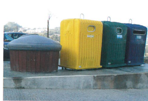
Continua a colocação de pontos ecológicos no Concelho