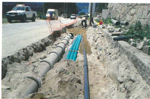
Colocação de infraestruturas no âmbito da construção da OROPOL