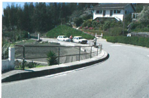
Colocação de gradeamento e pintura no lugar da Póvoa em parceria com a Junta de Freguesia