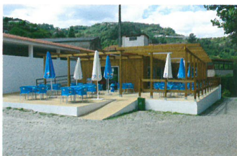
Construção de bar na zona de lazer do Castelo - Fornos