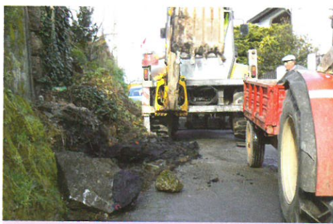
Construção de Valeta no Caminho de Carreiros em parceria com a Junta de Freguesia