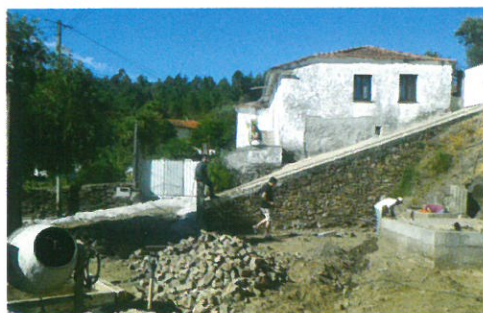
Arranjo Urbanístico no Centro da Póvoa em colaboração com a Junta de Freguesia