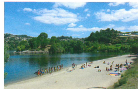
Colocação de areia na zona de lazer fluvial do Castelo - Fornos