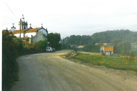
Alargamento do Caminho do Passal as Cancelinhas - Fornos