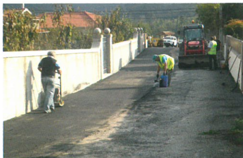
Pavimentação de alargamento no lugar de Cruz da Carreira