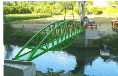
Substituição da Ponte na zona de Lazer da Croka em parceria com à EDP