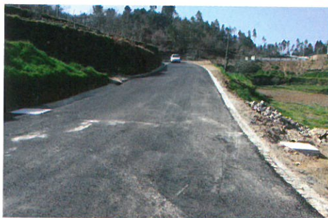
Pavimentação do acesso a APPACDM em Sabariz