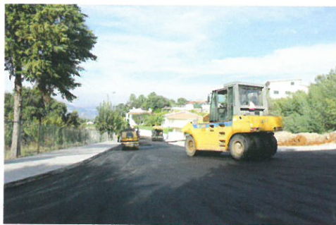
REQUALIFICAÇÃO URBANÍSTICA / Rua Jean Tyssen