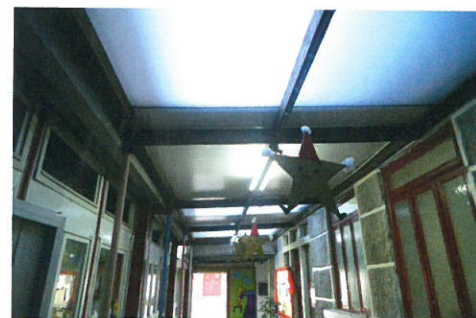
Substituição de cobertura nos Serviços Sociais da Câmara Municipal em S. Geão