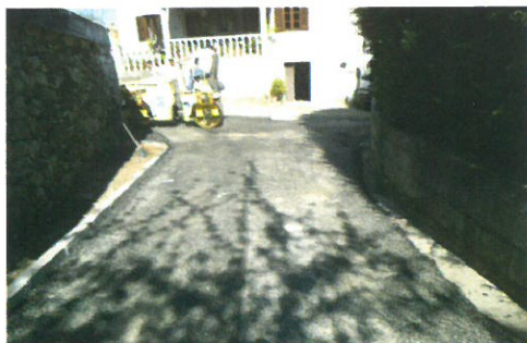
Pavimentação do Largo de Ância