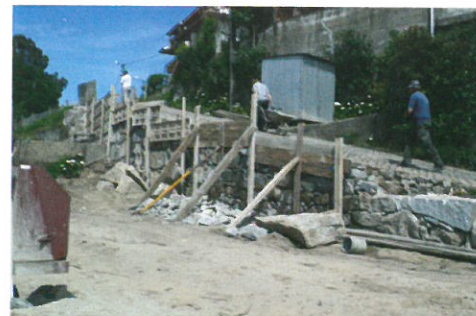
Construção de muro de suporte em Oliveira Reguengo