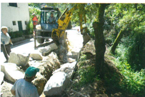
Construção de muro de suporte no lugar do Pejão