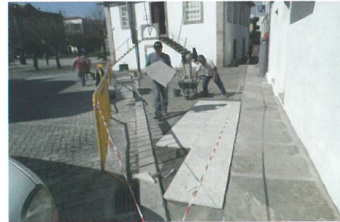
REQUALIFICAÇÃO URBANÍSTICA / Praça da República