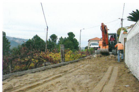
Construção de coletor de saneamento, substituição de conduta de abastecimento de água e pavimentação do caminho de Pereire