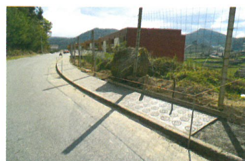
Construção de passeio no lugar de Montouro - S. Martinho em parceria com a Junta de Freguesia