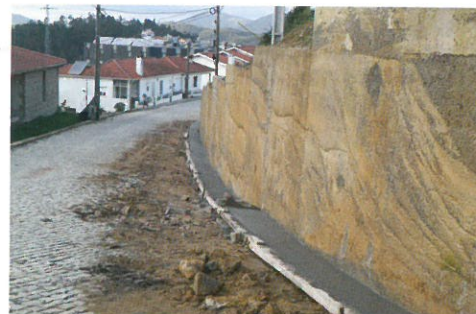
Alargamento da Rua da Corredoura