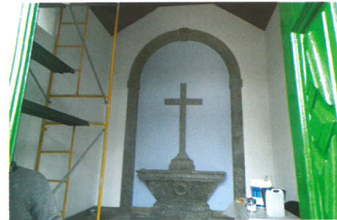
Restauro da Capela Mor do Cemitério da Ranha