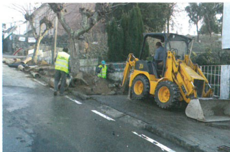
Requalificação de águas pluviais na Av.ª General Humberto Delgado