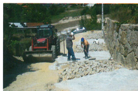
Calçetamento do alargamento do caminho das Cancelinhas - Fornos