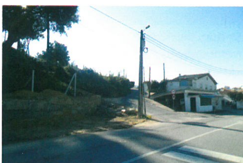
Alargamento de via no lugar de Cruz de Agra - S. Martinho com a colaboração da junta de freguesia