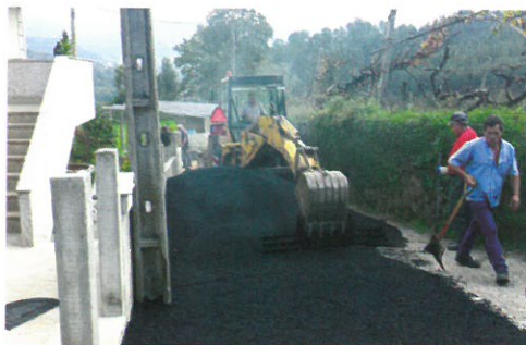
Pavimentação lugar de Pinheiro