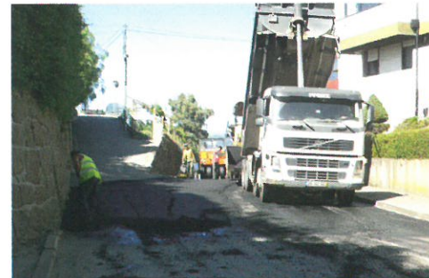
REQUALIFICAÇÃO URBANÍSTICA / Rua dos Bombeiros