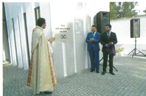
Colaboração com o Povo de Real e Junta de Freguesia na construção da Capela Mortuária/Capela Mortuária de Real