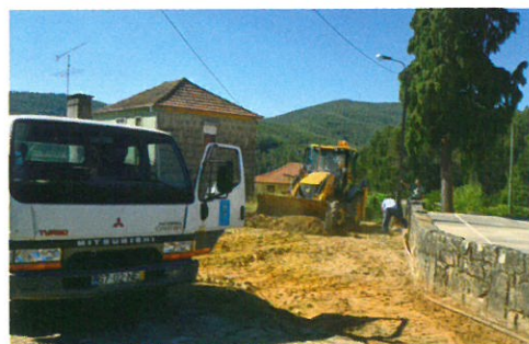
Alargamento e pavimentação do caminho da escola do Gilde com a colaboração da junta de freguesia