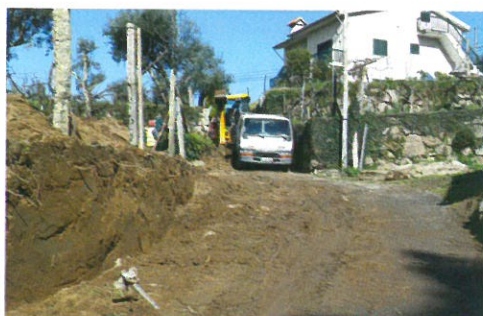
Alargamento do caminho de Valcovo - S. Martinho com a colaboração da Junta de Freguesia