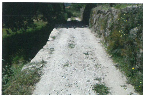
Reparação de muros no caminho de Leirós - Fornos