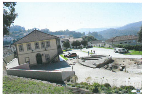
REQUALIFICAÇÃO URBANÍSTICA / Zona envolvente da Academia de Música de Castelo de Paiva