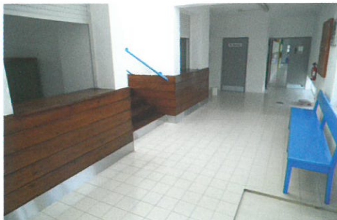
Obras de requalificação da Piscina Municipal