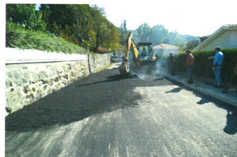
Pavimentação no caminho do Crosso - Fornos