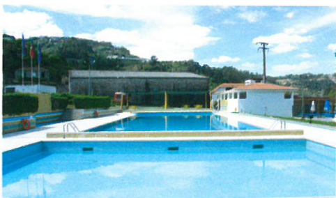
Requalificação dos balneários e infraestruturas de apoio a Piscina do Castelo - Fornos