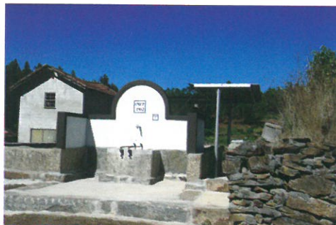
Recuperação do fontanário do lugar do Gilde em parceria com a junta de freguesia