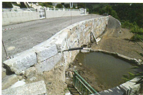
Reconstrução de Muro no Caminho do Minhotal